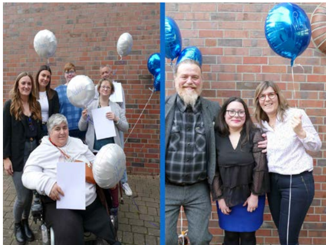
Stolze Teilnehmende, Sozialdienstkolleginnen, Absolventinnen und Gruppenleitung

Mit den Abschlussurkunden in den Händen startet nun der weitere berufliche Weg für die ehemaligen Teilnehmenden. Alle sind gespannt auf ihre neuen beruflichen Perspektiven, ob innerhalb der Rurtalwerkstätten oder ob ihr Weg sie direkt auf den allgemeinen Arbeitsmarkt führt – die Zukunft wird es zeigen.